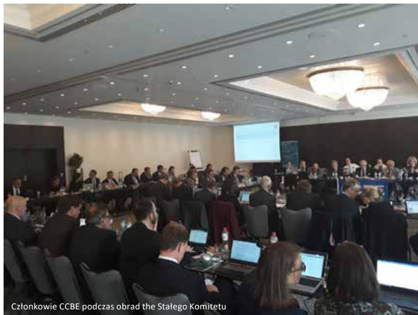
Członkowie CCBE podczas obrad the Stałego Komitetu

Podczas Stałego komitetu omówione zostały także najbliższe wydarzenia organizowane przez CCBE. W szczególności omówiono obchodzony 25 października Europejski Dzień Prawnika oraz Konferencję pt. Sztuczna inteligencja, ludzka sprawiedliwość , która odbędzie się 30 listopada w Lille, we Francji.