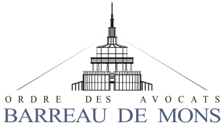
Belgique – Barreau de Mons