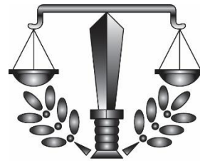
EESTI ADVOKATUUR ESTONIAN BAR ASSOCIATION