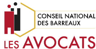
France – Conseil national des barreaux